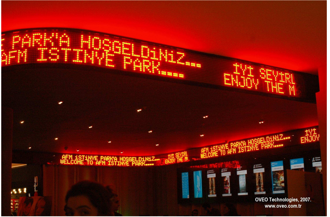
OVEO Technologies, 2007. www.oveo.com.tr