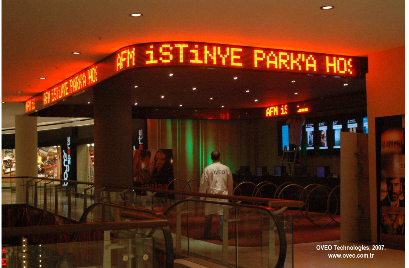
OVEO Technologies, 2007. www.oveo.com.tr

Alınlık Aktif Bölge Uzunluğu: 38 metre. Maksimum Harf Yüksekliği: 32cm veya 16cm seçilebilir. Tip: OVTD - Flexible PCB Sistemi. Pitch: 20mm. Yazılım: AFM için özel sinema gişe gösterim yazılımı. LED: TOYODA-GOSEI. Amber. 4 LED/piksel.